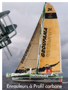
Enrouleurs à Profil carbone