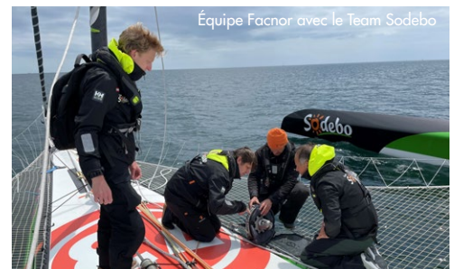
Équipe Facnor avec le Team Sodebo