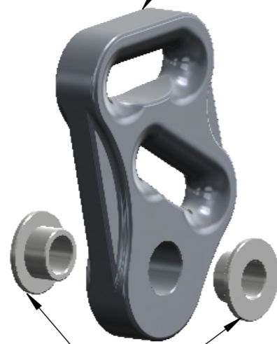
Lot de deux bagues inox Set of two SS flanged bushings