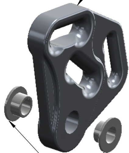
Lot de deux bagues inox Set of two SS flanged bushings